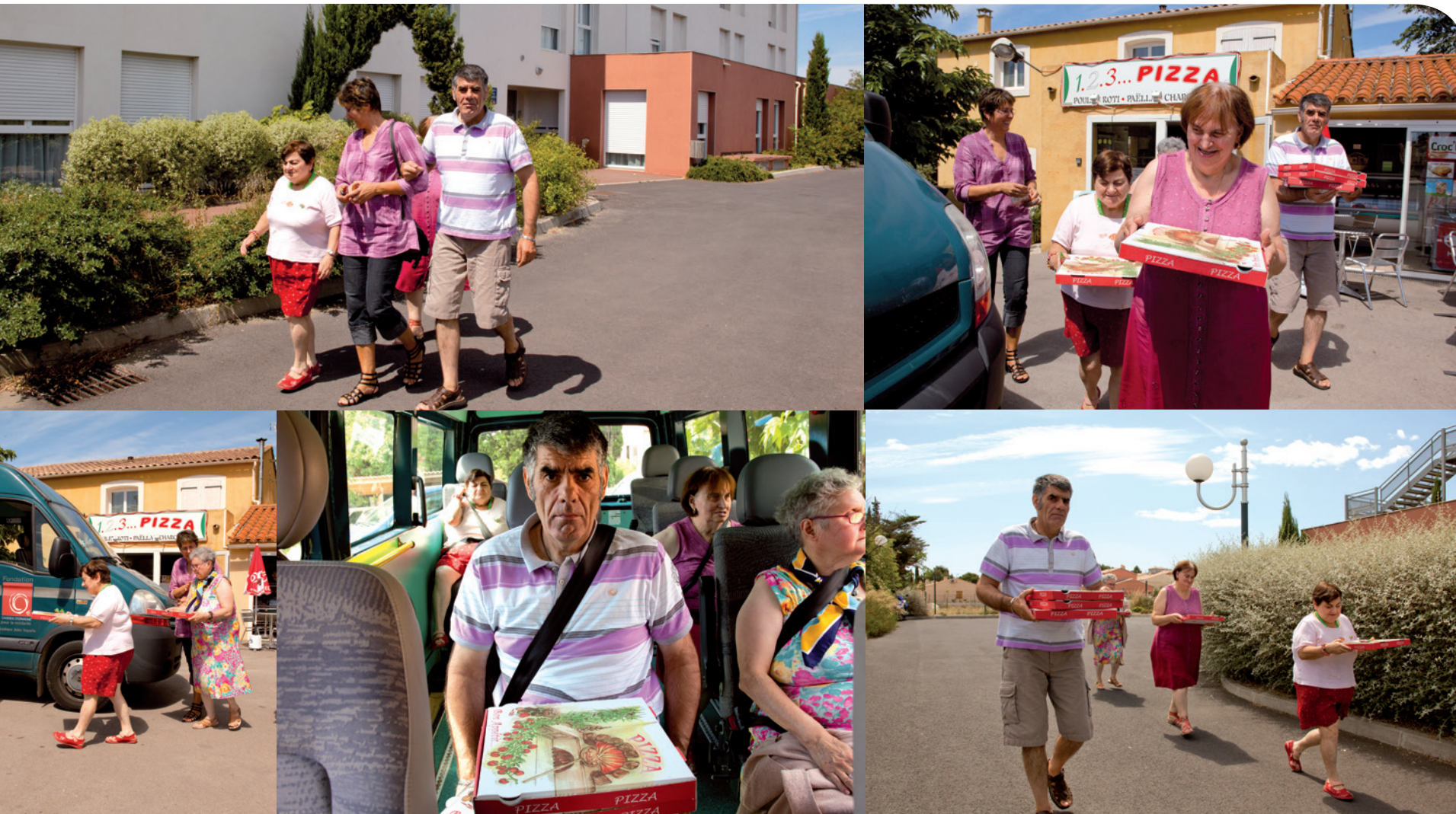
Unité Adultes handicapés vieillissants : l'animation, à la demande des résidents, peut être aussi de sortir acheter des pizzas pour aller pique-niquer.